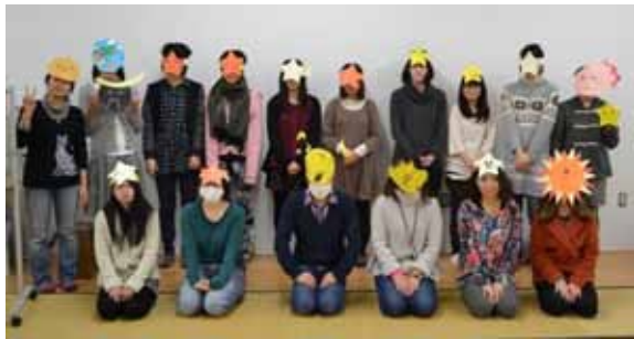
作った星お面をして集合写真