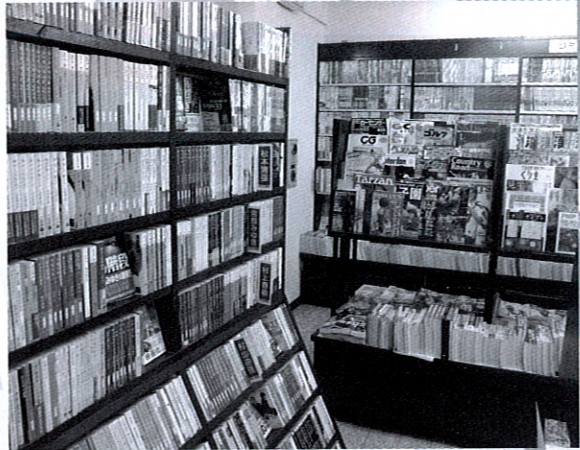
さまざまな本が並ぶ書店の店頭